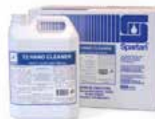
Presentación para Granel