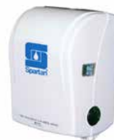
Dispensador de papel toalla autocorte plástico