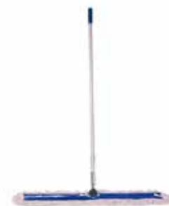
Kit Mopa Seca Algodón 60 cms.