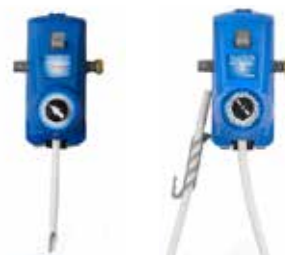
Dosificadores para botellas y baldes