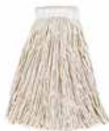
Mopa húmeda algodón 16 oz