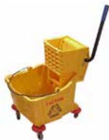
Carro exprimidor de mopa 20 o 33 lts.