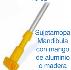
Sujetamopa Mandibula con mango de aluminio o madera