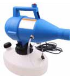
Nebulizador en frío K-450