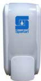
MANUAL SOAP Dispenser Mod SL-710M