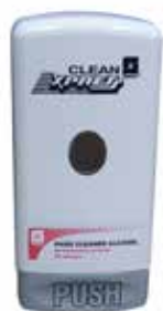
Dispensador Clean Xpress

Hay ciertas bacterias y virus cuya presencia es más habitual en los baños públicos, pues son transmitidas a través de las heces.