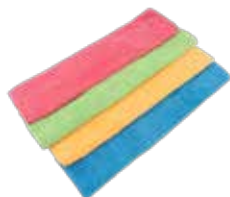
Paño de microfibra.