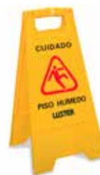
Señalética pisos húmedos.