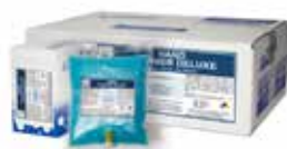
Presentación Clean Xpress